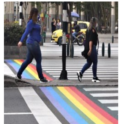
La Alcaldía de Medellín, Colombia y líderes LGTBI pintaron las calles de la ciudad buscando promover el respeto por la vida, sin discriminación sexual o de ideología de género.

No obstante, a partir de aquí empiezan las controversias entre lo que claramente está escrito en la Biblia y lo que una nueva tendencia de "cristianismo gay" ha venido a propagar imponiendo sus preferencias sexuales y evadiendo ciertas partes de las Escrituras que a continuación exponemos.