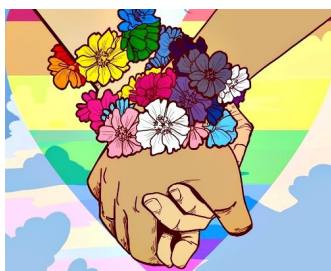
Imagen alusiva a Día Gay en México, 11 Oct 2018

“..el Señor estará con vosotros mientras vosotros estéis con Él. Y si le buscáis, se dejará encontrar por vosotros; pero si le abandonáis, os abandonará...” (2 Crónicas 15.2)