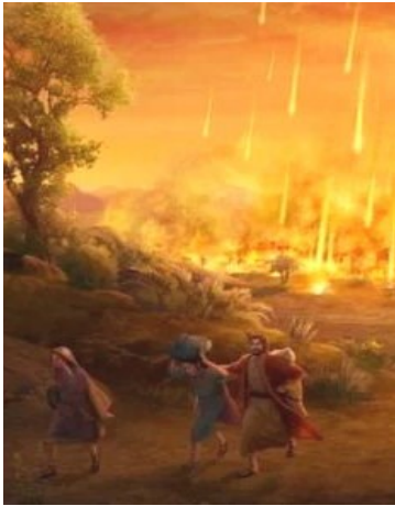
Destrucción de Sodoma y Gomorra en Génesis 19.

Claro que sí, y de forma puntual y explícita, pero dado que la mayoría de los LGBTI no leen la Biblia, entonces en su afán de ser aceptados por los demás, se dejan extraviar por aquellos que dicen conocer las Escrituras y que se escudan en que la palabra homosexual no existía en el tiempo que la Biblia fue escrita, y justo este es su argumento para no aceptar que la Biblia describe como pecado el uso contra naturaleza del sexo, conocido ahora como homosexualismo.